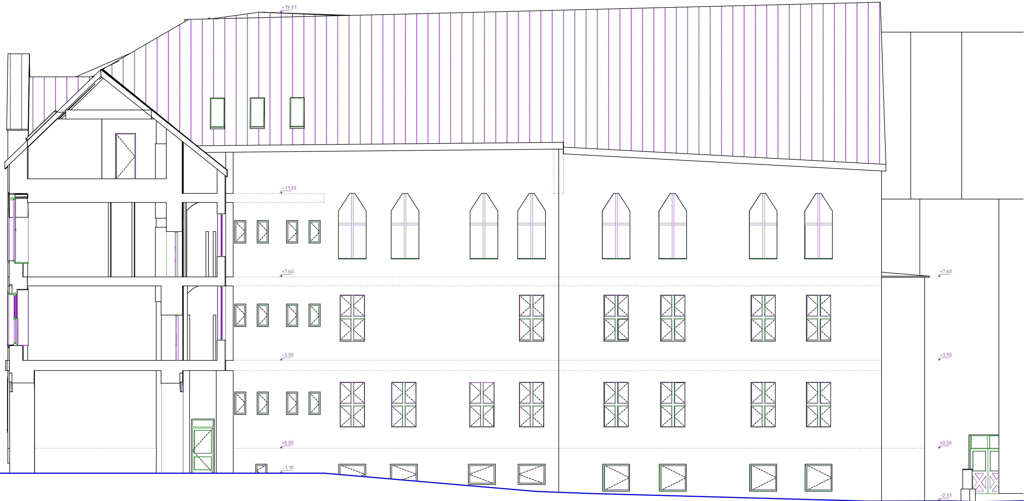
POHLED SCHODIŠTĚ SEVEROZÁPADNÍ STÁVAJÍCÍ STAV