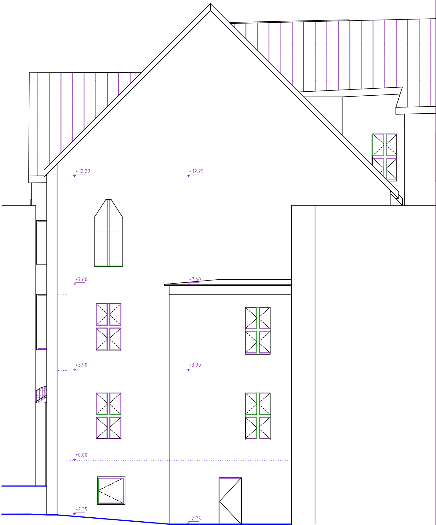
POHLED SEVEROZÁPADNÍ STÁVAJÍCÍ STAV

① STÁVAJÍCÍ PROSKLENÍ SCHODIŠTĚ - DEMONTÁŽ